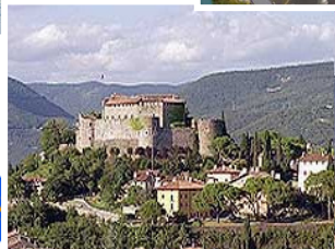
Programma «Europa per i cittadini»